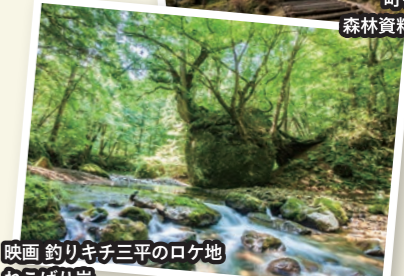
映画 釣りキチ三平のロケ地 ねこぼり岩