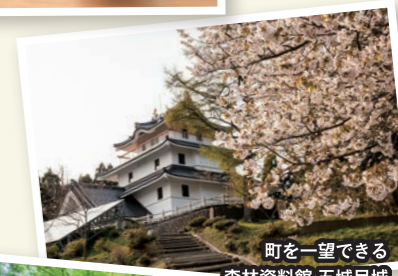
町を一望できる 森林資料館 五城目城