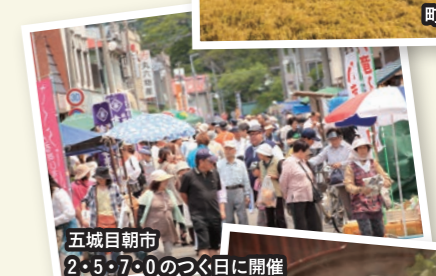
五城目朝市 2・5・7・0のつく日に開催