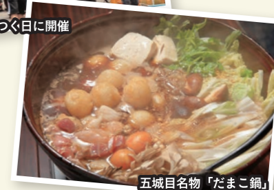
五城目名物「だまこ鍋」