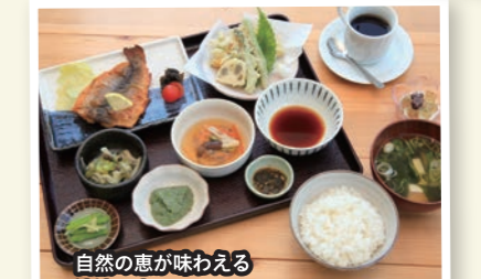
自然の恵が味わえる 清流の森